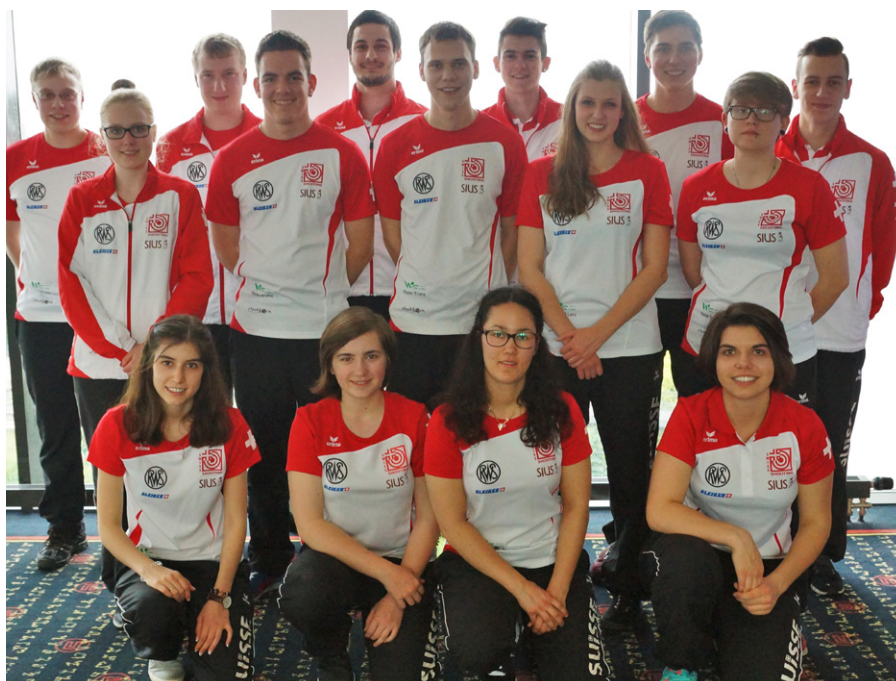
Erfolgreiches Schweizer Nachwuchsteam an den Shooting Hopes Pilsen.